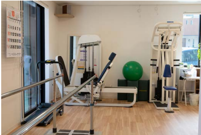
2種のマシンを完備