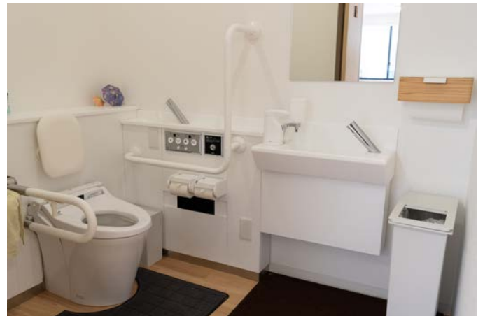
3ヶ所（普通2ヶ所・車椅子用1カ所）