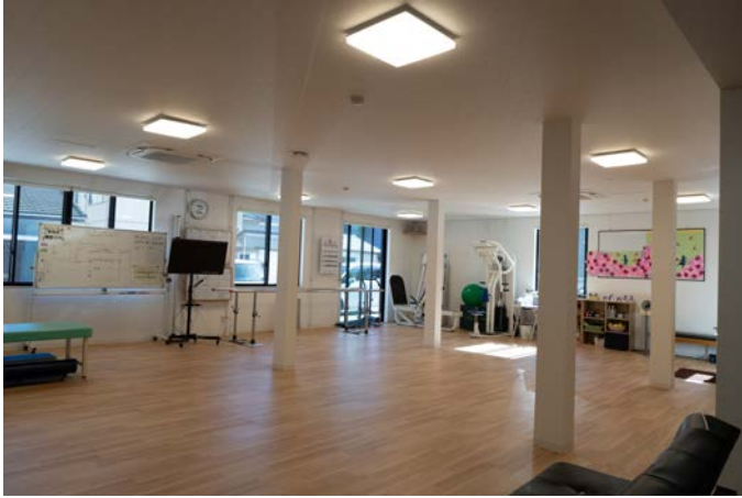
アクティビティの為のメインフロア