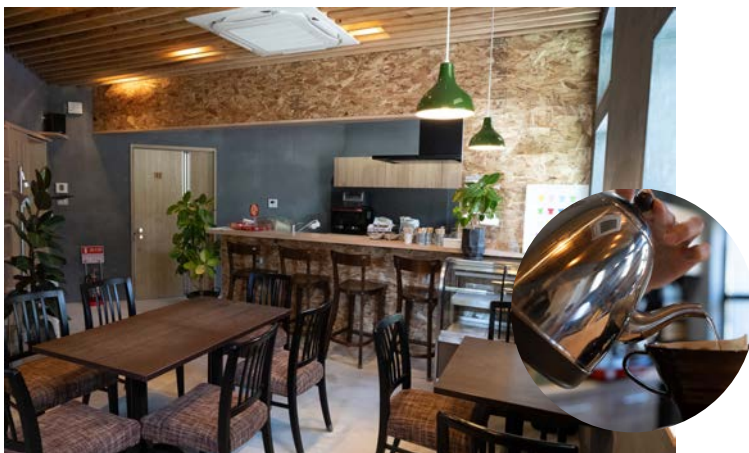
カフェタイムにご利用できるスペース